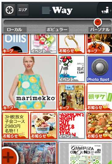
図 1. アプリ画面 UI (コンセプト版)